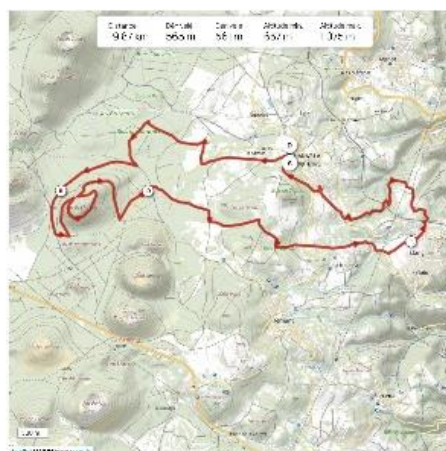
Parcours de trail permanent